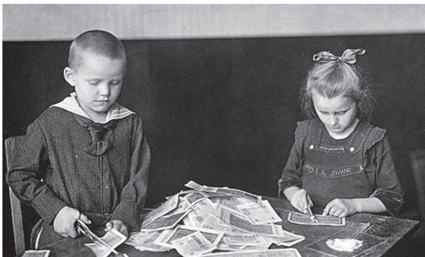
1923, Bambini tedeschi che giocano con mucchi di banconote senza più valore, i vecchi papiermark destinati al macero

1923. E per farlo dobbiamo andare nella Germania sconfitta dopo la prima guerra mondiale, che fino all'ascesa di Hitler veniva chiamata convenzionalmente Repubblica di Weimar. I tedeschi al termine del conflitto erano stati condannati dai trattati di pace a risarcire esosi danni di guerra, danni superiori alle capacità economiche del paese.