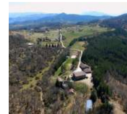
In alto, l'ostello Rerum Natura

A sinistra, il QR Code dei "Borghi narranti" di Orvinio: ascolta la storia dei Calzolai dei monti Lucretili