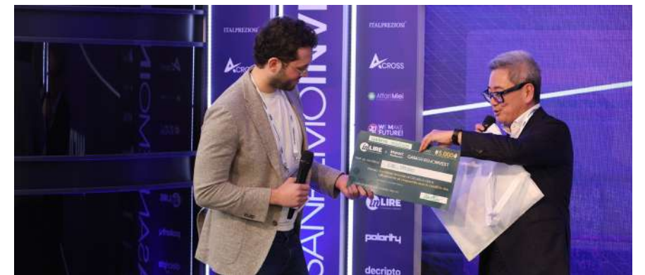
CDC_Studio, vincitrice del Premio in-Lire