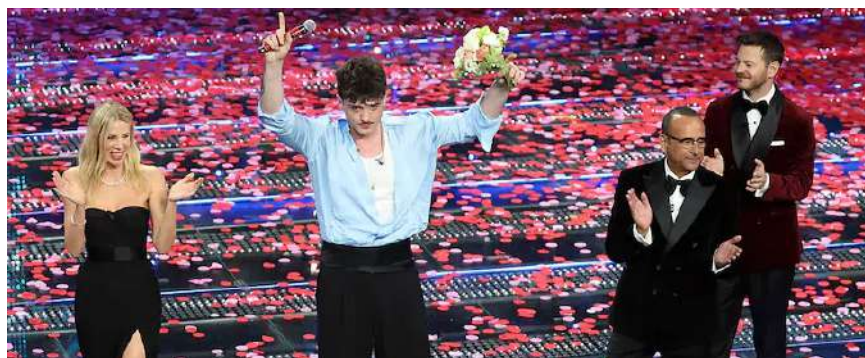
Vincitore di Sanremo 2025