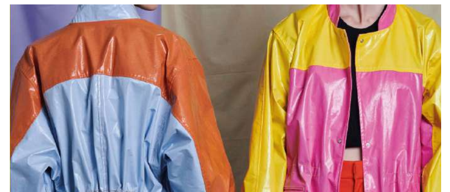
Capi d'abbigliamento realizzati con "CÔÊO", la tecnologia che recupera cascami di produzione e vecchi tessuti per dar vita a nuovi modelli sostenibili

La competizione ha messo in palio dieci premi speciali offerti da realtà come We Make Future, Lifegate Way, Wise Gate, Bix Incubator, Khoroline, Polarity, Feat Ventures, WeAreStarting e in-Lire. Impact 4 Tomorrow si augura di rappresentare il primo passo di un anno ricco di investimenti coraggiosi e lungimiranti, incentivando un dialogo sempre più aperto tra startup, investitori e istituzioni. Per costruire il futuro bisogna infatti agire oggi, sfruttando tecnologie e competenze per creare modelli di business profittevoli e sostenibili. Il premio di in-Lire è andato a CDC_Studio , che si occupa di sostenibilità nella filiera dell'abbigliamento, e che attraverso una costante ricerca, ha sviluppato soluzioni tailor made per lo smaltimento delle rimanenze di magazzino e dei cascami di lavorazione.