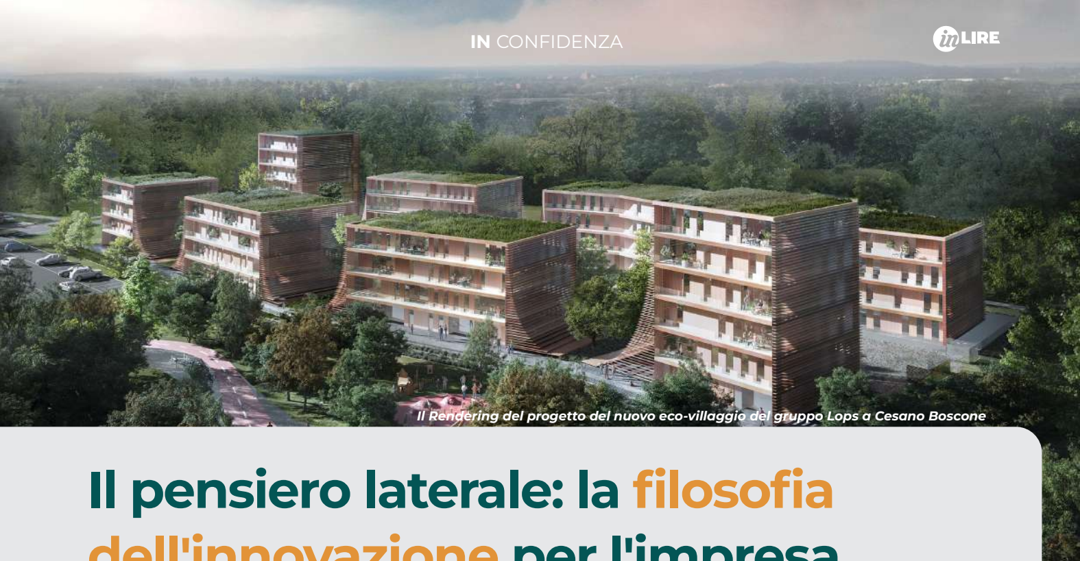
Il Rendering del progetto del nuovo eco-villaggio del gruppo Lops a Cesano Boscone