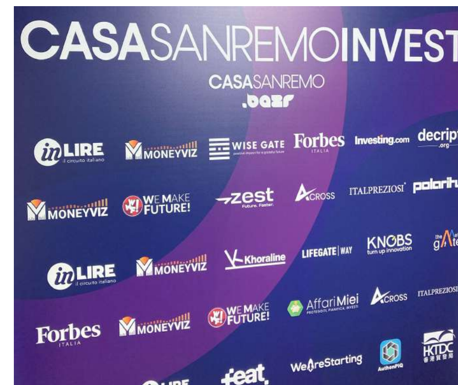
Nella foto, tutti gli sponsor dell'evento CasaSanremoInvest

Lo svolgimento è risultato davvero contagioso, con investitori ed operatori economici coinvolti nelle dinamiche per loro inedite della moneta complementare e del credito compensativo. Stiamo parlando della relazione tenuta da Romi Fuke, Presidente e CEO di in-Lire Spa società Benefit alla platea di Casa Sanremo Invest, la kermesse del Fuori Festival organizzata anche quest'anno da Moneyviz. L'evento ha previsto una tre giorni di speech su Web 3.0, Intelligenza Artificiale, Finanza, Sostenibilità e Impatto positivo. E nel dibattito su questi argomenti di grande attualità, ancora una volta Circuito in-Lire ha avuto un ruolo da protagonista.