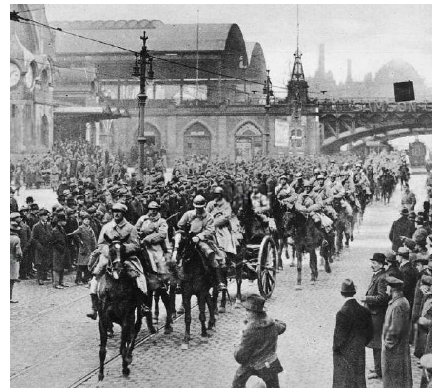
1923: le truppe franco-belghe occupano la Ruhr dopo il default della Germania rispetto al pagamento del debito inflitto dai Paesi vincitori per i danni di guerra

to finanziario. D'altro canto un esempio emblematico è la crisi finanziaria del 2008 con il fallimento di Lehman Brothers, che ha avuto conseguenze drammatiche sull'economia globale. Il crac di una delle principali banche americane è stato però un Cigno Nero che ha avuto un illustre precedente: nel 1929, solo sei anni dopo l'iperinflazione della Repubblica di Weimar, avvenne il primo crollo nella storia di Wall Street, la Borsa USA. Era il 29 ottobre di quell'anno e in un solo giorno furono vendute più di 16 milioni di azioni dei principali titoli del listino. A fine giornata erano stati persi più di 10 miliardi di dollari di capitalizzazione, una fuga di denaro dal mercato che diede inizio ad una colossale spirale recessiva dell'economia mondiale, la Grande Depressione. Speriamo quindi che il proverbio popolare del "non c'è il due senza il tre" non si confermi clamorosamente nel prossimo futuro.