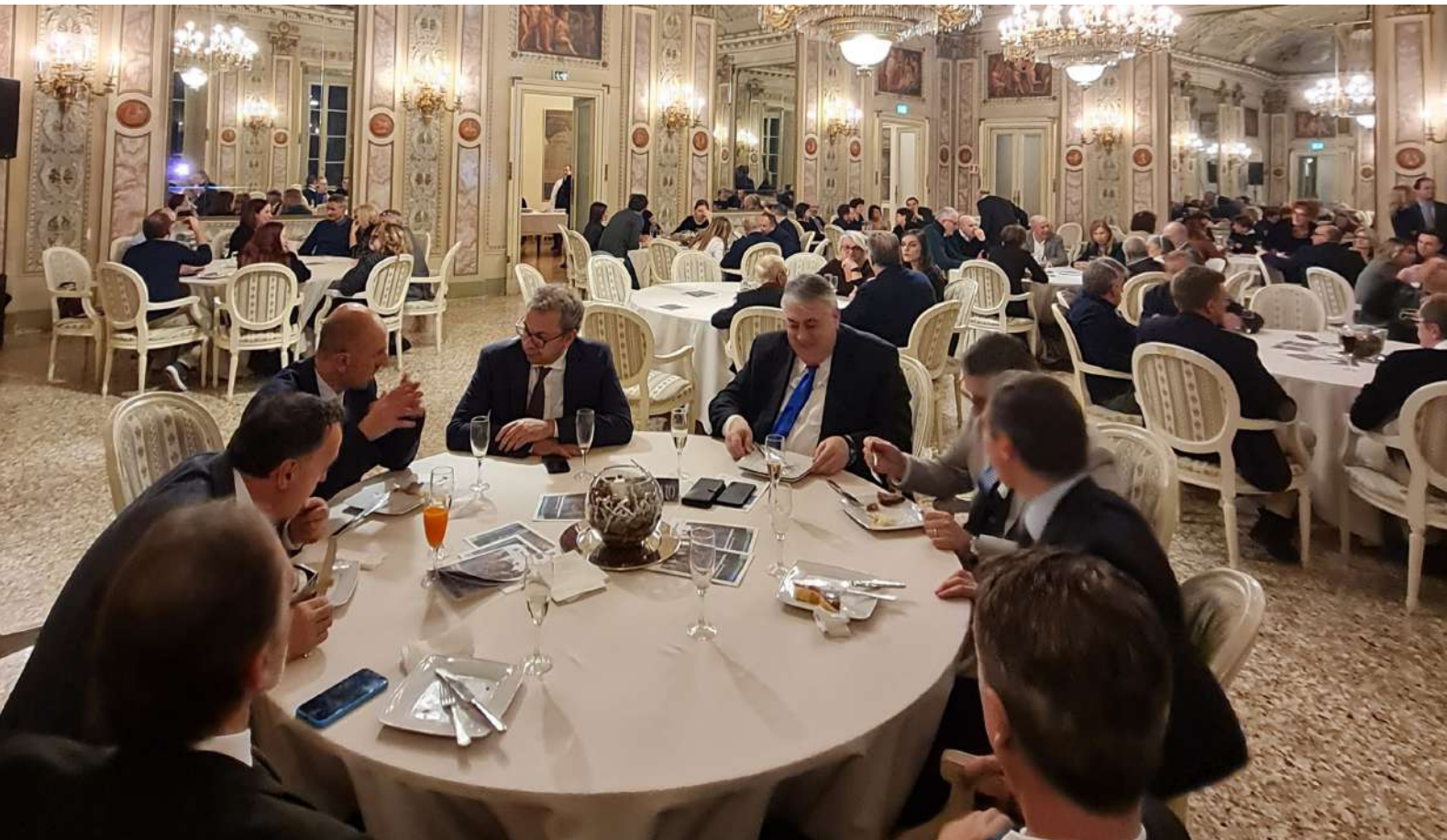
Nella foto un evento di matching tra imprese organizzato dalla Compagnia delle Opere

di impegno sociale che non si dimentica di chi è in difficoltà, perché con noi opera il Banco di Solidarietà, il Banco Alimentare e il Banco Farmaceutico, e collaboriamo tutti gli anni con un evento culturale internazionale come il Meeting di Rimini. Cosa ci azzecca la CdO con il Meeting di Rimini? Proprio qui a Como dall'esperienza del Meeting abbiamo portato a casa lo spunto per dar vita ad un ciclo di incontri su Dante, il Sommo Poeta, ed anche in questo caso si è trattato di un incontro quasi casuale con il professore Nembrini, grande divulgatore della Divina Commedia, in un periodo difficile come quello della pandemia. Forse proprio l'emergenza Covid ci ha fatto rendere conto che Dante nel suo capolavoro parla anche di noi, del mondo del lavoro e dei suoi problemi, e anche se lo fa settecento anni orsono il suo pensiero è attuale come se fosse stato scritto oggi. Siamo partiti con una serie di in-