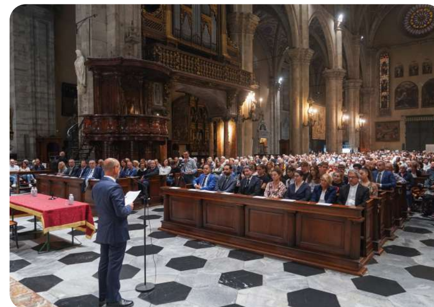
Nella foto la presentazione della mostra su Dante nel Duomo di Como

una linea di valigie fatte interamente con materiale riciclato, e ci è venuta l'idea di innescare una sinergia che ha creato un progetto promozionale: abbinare alla vendita della Megane elettrica l'omaggio del set di valigie. Per concludere, anche i progetti che vogliamo mettere in pista per il prossimo futuro sono tanti, ma se devo parlare di quello che ci sta più a cuore sicuramente è lo sviluppo dell'Academy di CdO. Si tratta della struttura che si occupa di Formazione e Cultura d'Impresa, e per renderla ancora più efficace quest'anno la vogliamo rendere itinerante nelle principali aziende che aderiscono al nostro network sul territorio comasco; affronteremo temi diversi, una volta potrà essere il passaggio generazionale nelle imprese familiari, un'altra volta l'internazionalizzazione. Una formazione che vogliamo fare attraverso la testimonianza di esperienze concrete e la collaborazione con l'Università di Bergamo, che ci ha supportato con i suoi docenti fin dalle origini dell'Academy.