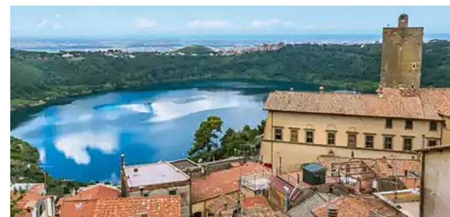
Dal borgo di Castel Gandolfo, il panorama del lago Albano

Le prime fioriture ci segnalano che la primavera è arrivata e nel fine settimana cresce la voglia di "staccare" dagli impegni di lavoro per ricaricare le pile. Anche su questo tema un Circuito di credito compensativo si può rivelare una preziosa occasione, consentendoci di cogliere delle occasioni che potremo ripagare con un fatturato incrementale. Da Roma, Milano e Perugia tre opportunità di fuori porta tra le mille occasioni che ci riserva la nostra bella Italia. Appena fuori dalla capitale ci si può perdere nel panorama collinare dei Castelli Romani, che accanto a golosi tour enogastronomici ci riserva itinerari naturalistici e monumentali sorprese; uscendo dall'area metropolitana milanese ci aspetta invece il parco cintato più grande d'Europa, che contorna la splendida Reggia sabauda di Monza, il capolavoro architettonico neoclassico del Piermarini; ed infine, nel cuore verde del Bel Paese, ci sono da ripercorrere gli itinerari francescani di Spello, Gubbio ed Assisi, tre dei più famosi borghi medievali di un territorio che non finirà mai di sorprenderci.